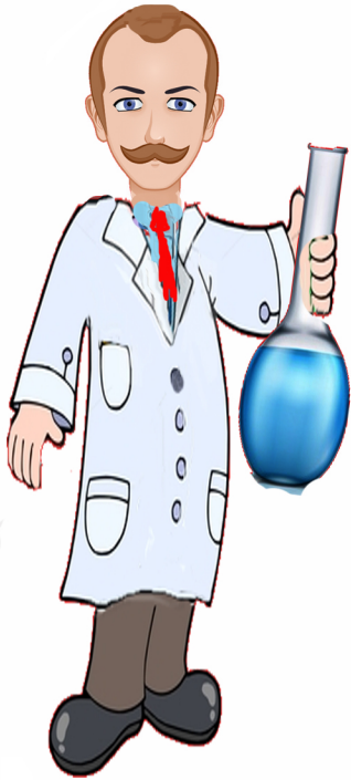
Dr. Carlos Chagas