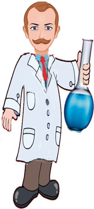
Dr. Carlos Chagas