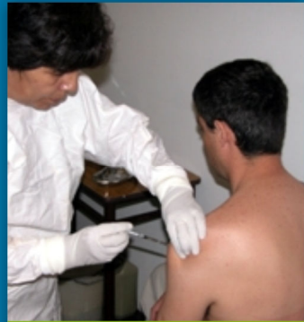
Vacuna Candid #1

NO SE DISPONE DE UNA VACUNA CONTRA LOS HANTAVIRUS NI PARA EL DENGUE